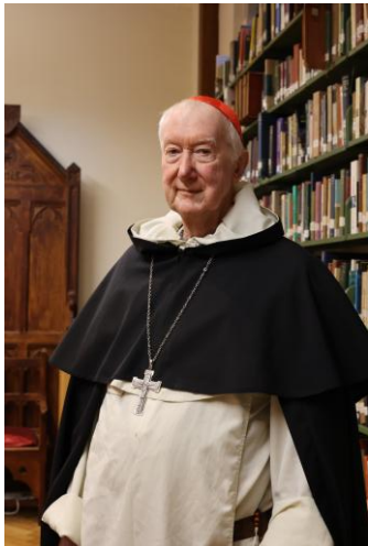
Kardinal Timothy Radcliffe OP

„Ich gebe euch ein Herz aus Fleisch“ (Ezechiel 36,26)