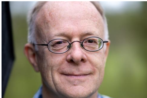
P.Dr. Jörg Alt SJ Aktivist für Friedensarbeit, sozio-ökologische Transformation

Erfahrungsbericht vom ganz persönlichen Einsatz für eine sozial-ökologische Transformation