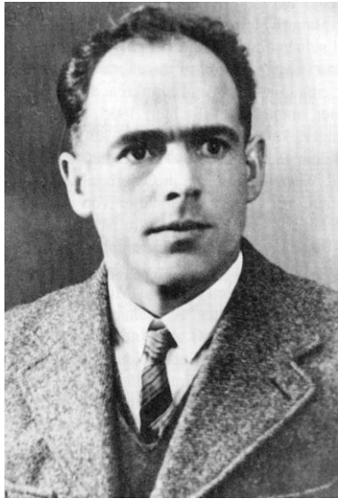
Seliger Franz Jägerstätter

Märtyrer, Kriegsdienstverweigerer, Bauer, Familienvater aus St. Radegund in OÖ